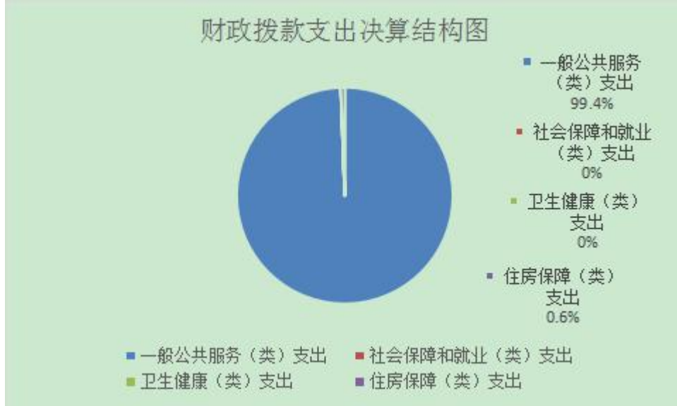
财政拨款支出决算结构图