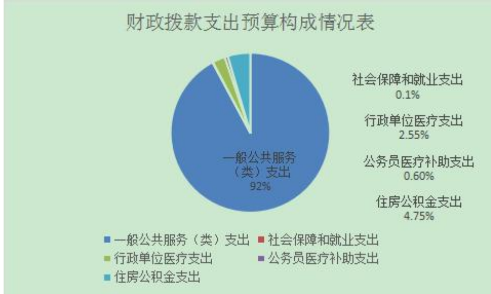
财政拨款支出预算构成情况表