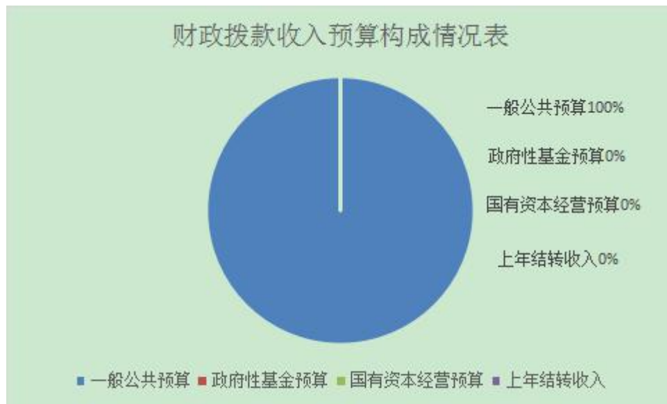
财政拨款收入预算构成情况表

2021 年财政拨款支出预算为 29.93 万元，其中：一般公共服务（类）支出 28.14 万元，占 94%；社会保障和就业支出 0.02 万元，占 0.06%；行政单位医疗支出 0.59 万元，占 1.97%；公务员医疗补助支出 0.14 万元，占 0.45%；住房公积金支出 1.04 万元，占 3.52%。