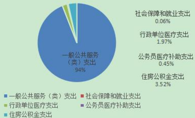
财政拨款支出预算构成情况表